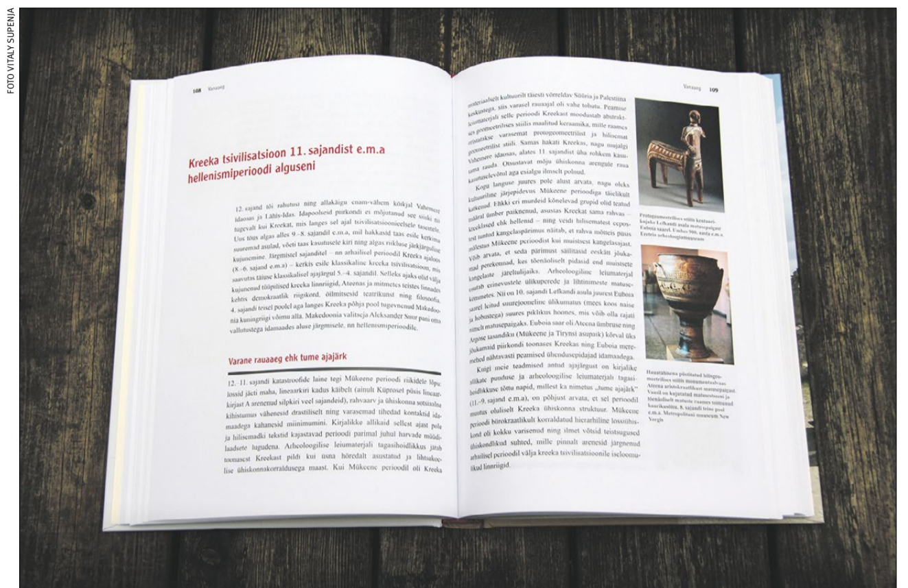
Lehekülged koguteosest: raamatu tekst on hästi liigendatud ja rikkalikult illustreeritud.

Tegemist on teosega, mis ostetakse kodusse raamaturiivis, ka siis, kui hetkel ei teata, millal võiks seda vaja minna. Ka raamatukaupluses võib see kaua oodata tänuhulka ostjat, sest raamatu väärtus ajas nimetamisväärselt ei kahane. Arvestades üsna väikest tegusate üldajaloolaste hulka, võib arvata,