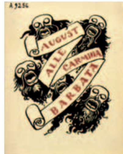
Kriitikute arvates oli August Alle „Carmina barbata” ajalaulude laadis „õnnelik erand”.