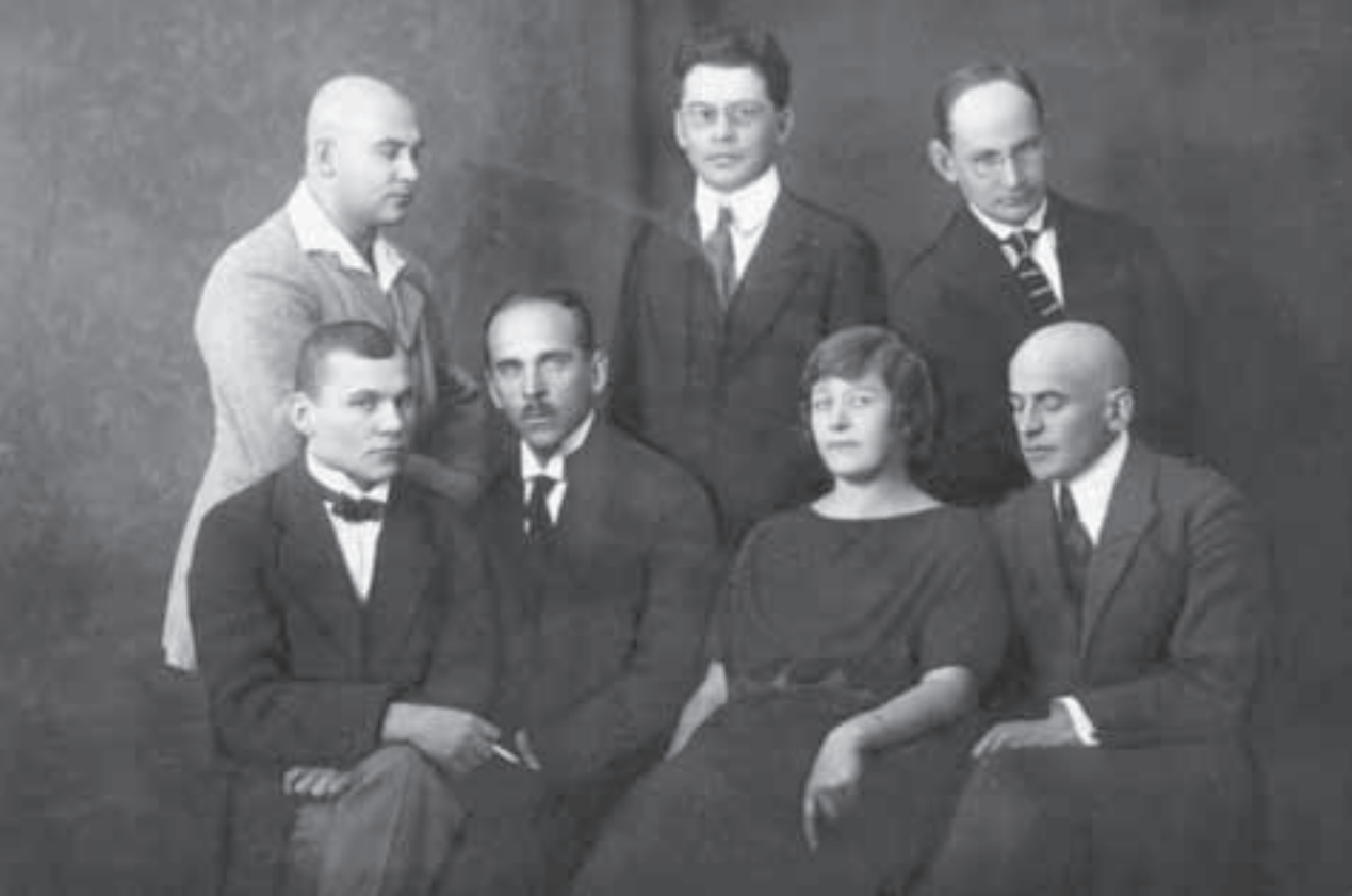
Tarapitlased 1921. aastal. Ees: Albert Kivikas, Johannes Semper, Marie Under, Artur Adson. Taga: Johannes Barbarus, Friedebert Tuglas, August Alle.