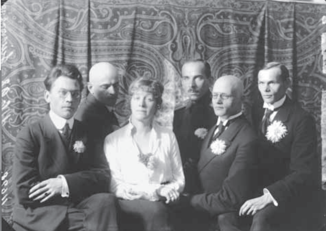
Siuru moodustasid Friedebert Tuglas, Artur Adson, Marie Under, Johannes Semper, August Gailit, Hendrik Visnapuu.