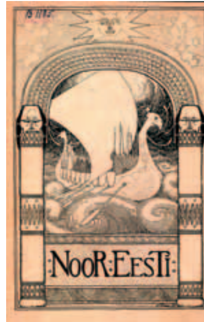
Varasema eesti kirjanduse seisukohtadele selgesti vastanduvad seisukohad on sõnastatud Noor-Eesti III albumis.

Uued programmilised seisukohad, mis selgesti vastandusid varasema eesti kirjanduse seisukohtadele, on sõnastatud Noor-Eesti III albumis (1909), kõige selgemini Friedebert Tuglase essees „Eduard Vilde ja Ernst Peterson” (vt Tekste). Tuglas arvustas teravalt eesti realistide loomingut, pidades seda kunstiliselt vähenõudlikuks ja teostuselt ebaühtlaseks. Ta heitis autoritele ette vähest tähelepanu teoste ülesehitusele ja stiililisele ühtsusele.