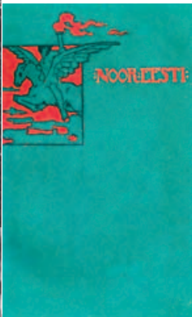
Noor-Eesti rühmituse esimene album

20. sajandi algus oli Eestis uue ühiskondliku tõusu aeg.