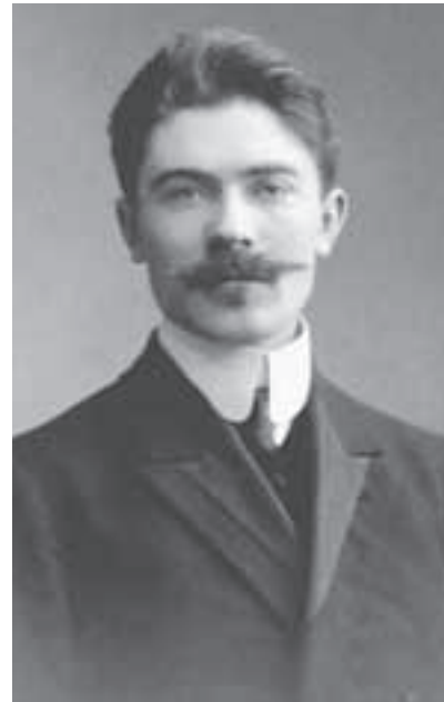
Sajandialguse keeleuendaja Johannes Aavik

Nooreestlased pooldasid Aaviku mõtteid keeleuenduse vajalikkusest. „ See, mis arvatakse mäng ja moehaigus olevat, on tõepoolest õige vajadus. Kes meist poleks kannatanud eesti keele vaesuse ja harimatuse all! “ kirjutas Friedebert Tuglas. Samas ei rakendanud nooreestlased Aaviku põhimõtteid siiski kohe ja korraga ning jäid uute sõnade tuletamisel ja kasutuselevõtul enamasti mõõdukuse piiridesse. Aaviku ja nooreestlaste keeleuenduslik tegevus on innustanud ka hilisemaid luuletajapõlvkondi.